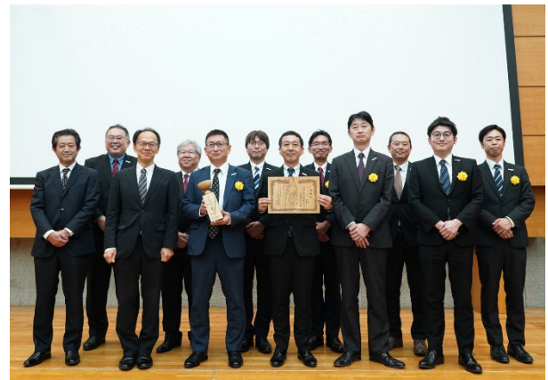
左：三菱電機 ZEB 関連技術実証棟「SUSTIE」南面。Low-e 複層ガラスと水平庇で、屋内の明るさを確保しつつ冷暖房負荷の低減を図っています。 右：カーボンニュートラル賞表彰式（2024 年 5 月 15 日（水）、建築会館ホール／東京都港区にて）における表彰の様子。